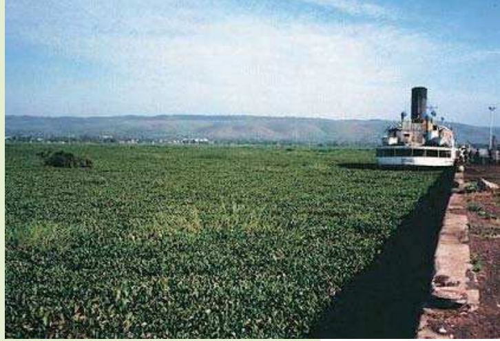
Victoria Gölü, su sümbülleri

Güney Amerika'ya has bu bitki türü, dünyadaki en zararlı su otu türü olarak görülmektedir. Göz alıcı, büyük, pembe ve menekşe rengindeki çiçekleri, bu bitki türünü çiftlik göletlerinde çokça kullanılan bir süs bitkisi haline getirmiştir. Bugün beş kıtada 50'den fazla ülkede görülebilmektedir. Su sümbülü çok hızlı büyüyen bir bitki türüdür ve 12 gün içerisinde sayısını ikiye katlayabilmektedir. Su sümbülleri etrafa yayılarak suyollarını tıkamış, deniz araçları trafiğini, yüzmeye ve balıkçılık faaliyetlerini kısıtlamıştır ve kısıtlamaya devam etmektedir. Su sümbülü aynı zamanda güneş ışığı ve oksijenin su sütununa ve su altındaki bitkilere ulaşmasına engel olmaktadır. Yerli su bitkilerini gölgeleyen ve karıştıran bu bitki, su ekosistemlerindeki biyolojik çeşitliliğin azalmasına yol açmaktadır.