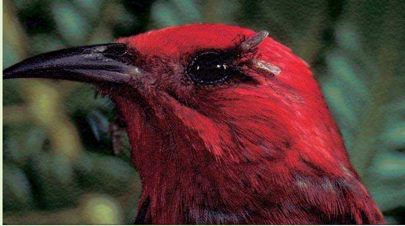
Sıtmalı havai ispinozu ve sivrisinekler

Sivrisineklerin taşıyıcı rolünü üstlendikleri kuş sıtması vakaları, Hawaii'de yaşayan en az 10 yerli kuş türünün yok olmasına ve birçoğunun varlığının tehdit edilmesine yol açmıştır.